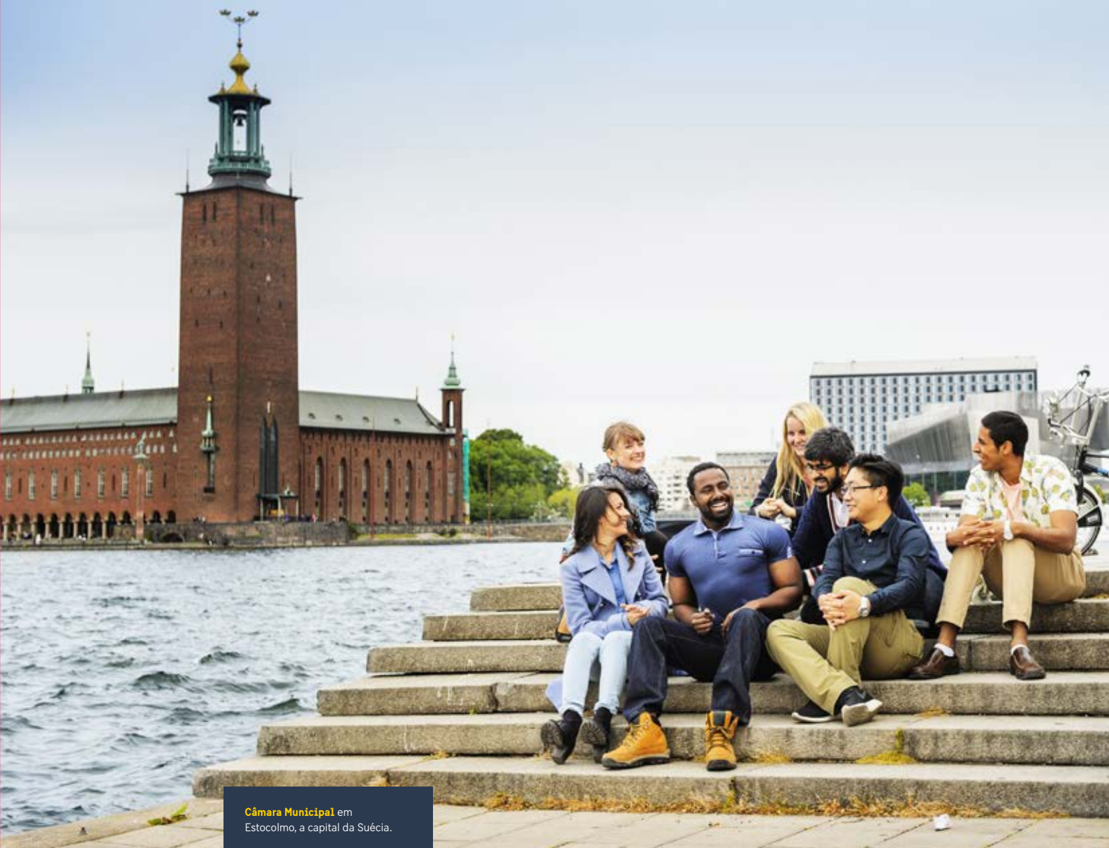
Câmara Municipal em Estocolmo, a capital da Suécia.