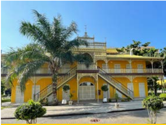
Palácio de Ferro, é um centro cultural importante em Luanda.