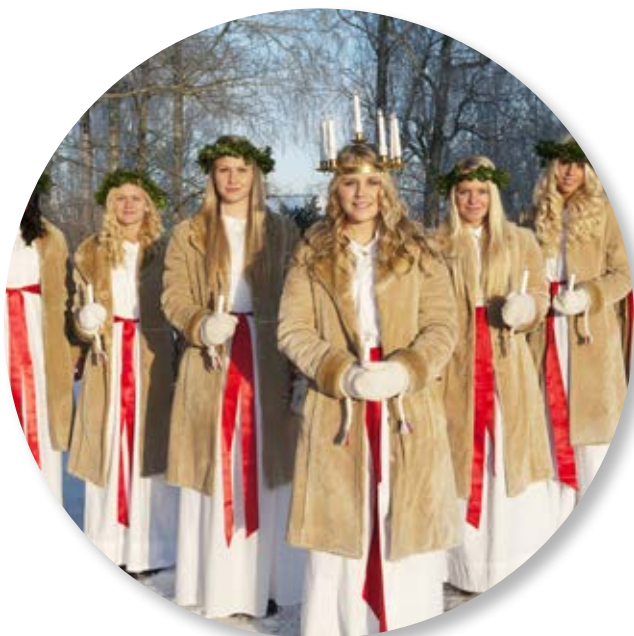
Comemorando Lucia em Köping na Suécia.

No Dia de Santa Lucia , é comum ver por toda a Suécia procissões e corais. Nesses eventos, a menina que representa Lucia usa uma túnica