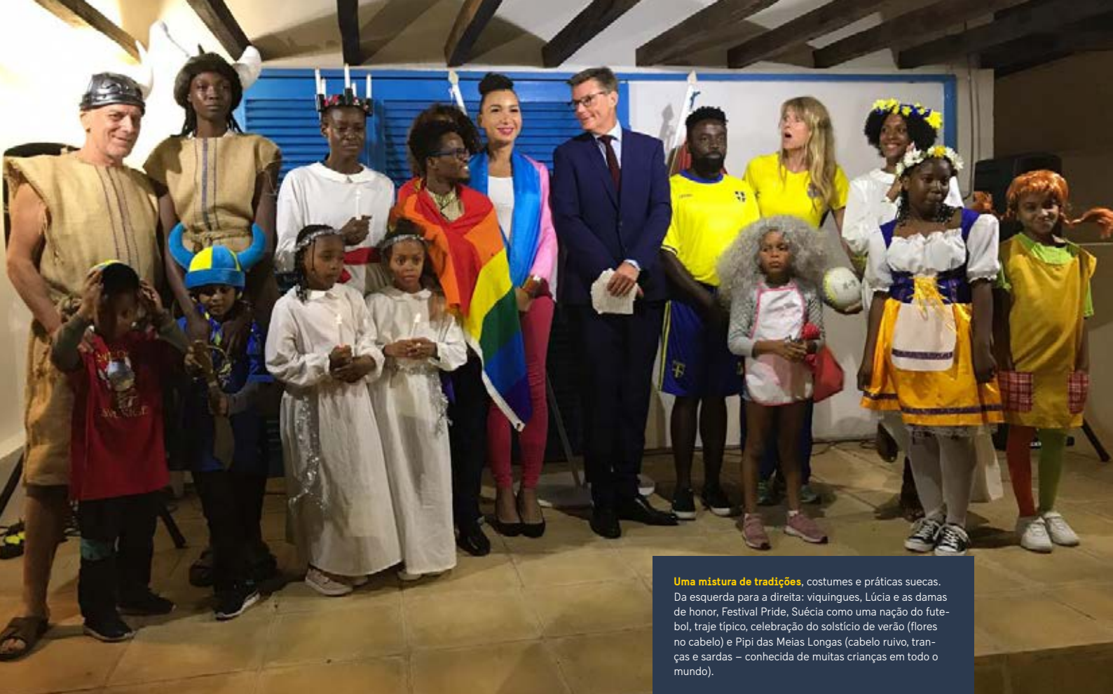
Uma mistura de tradições , costumes e práticas suecas. Da esquerda para a direita: vikingues, Lúcia e as damas de honor, Festival Pride, Suécia como uma nação do futebol, traje típico, celebração do solstício de verão (flores no cabelo) e Pipi das Meias Longas (cabelo ruivo, tranças e sardas – conhecida de muitas crianças em todo o mundo).

No dia de Santa Lucia, 13 de dezembro, suecos têm uma das mais importantes tradições com procissões, corais e bebidas e comidas típicas.