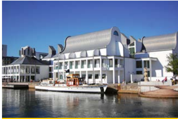
Dunkers, centro cultural conhecido em Helsingborg.